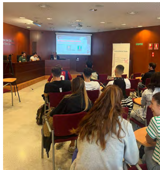
Imatges dels ponents amb el director de la Càtedra, i dels assistents