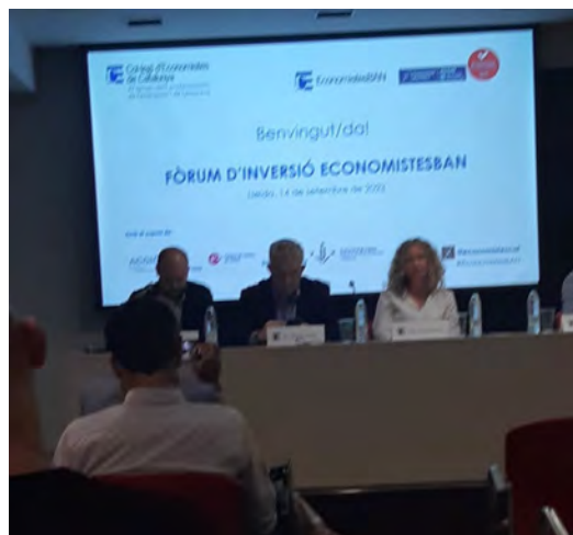
Imatge de la presentació del Fòrum