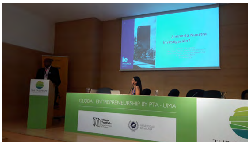
Imatge d'una de les ponències

I participació al VIII International Workshop on Entrepreneurship Research GEM-ACEDE: "Research driven Entrepreneurshio" organitzat per GEM Espanya i ACEDE.