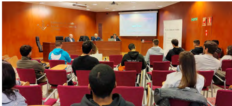
Imatges dels ponents amb el director de la Càtedra, i dels assistents