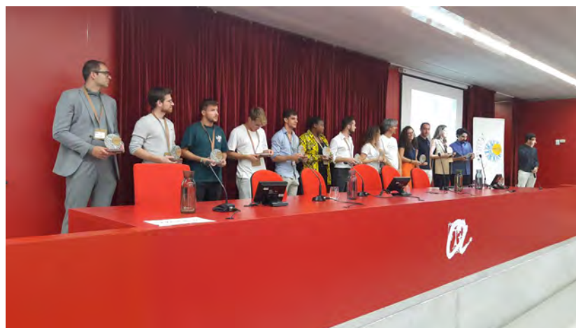
Imatge de grup dels alumnes de la UdL que van assistir a la Mostra acompanyats del director de la Càtedra i la vicerectora d'Estudians i Ocupabilitat, i una imatge dels participants i guardonats de la Mostra.