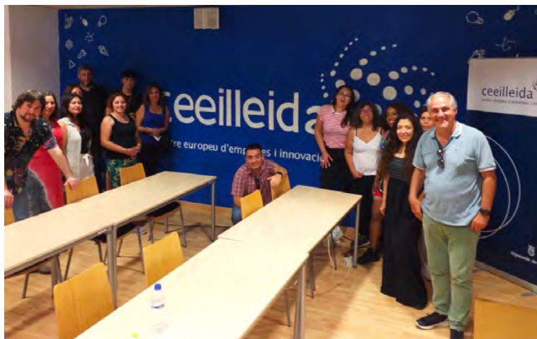
El director de la Càtedra amb els estudiants xilens

El director de la Càtedra, va acompanyar a estudiants de màster xilens en una visita a les instal·lacions del viver d'empreses del ceelleida per a explicar-los i que coneguin l'ecosistema emprenedor de Lleida.