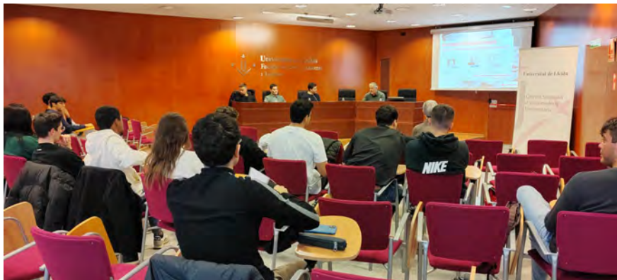
Imatges dels ponents amb el director de la Càtedra, i dels assistents