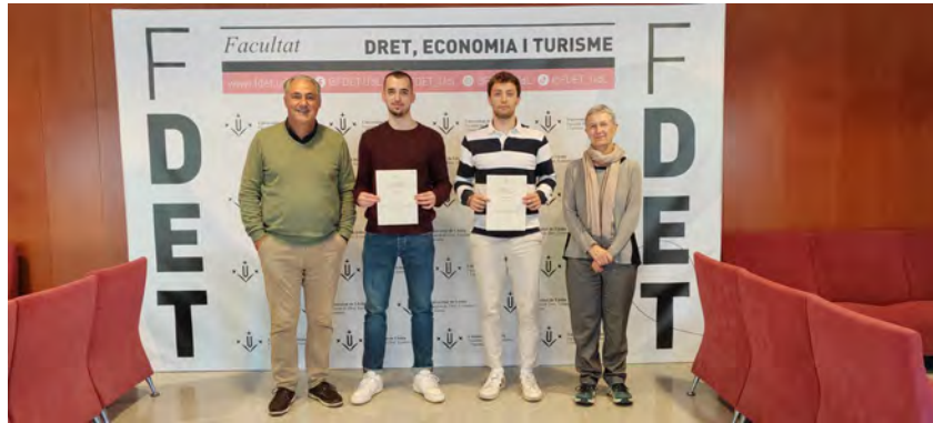
Imatges de la presentació dels premis i dels premiats amb el director de la Càtedra i la Vicerectora d'Estudiants i Ocupabilitat