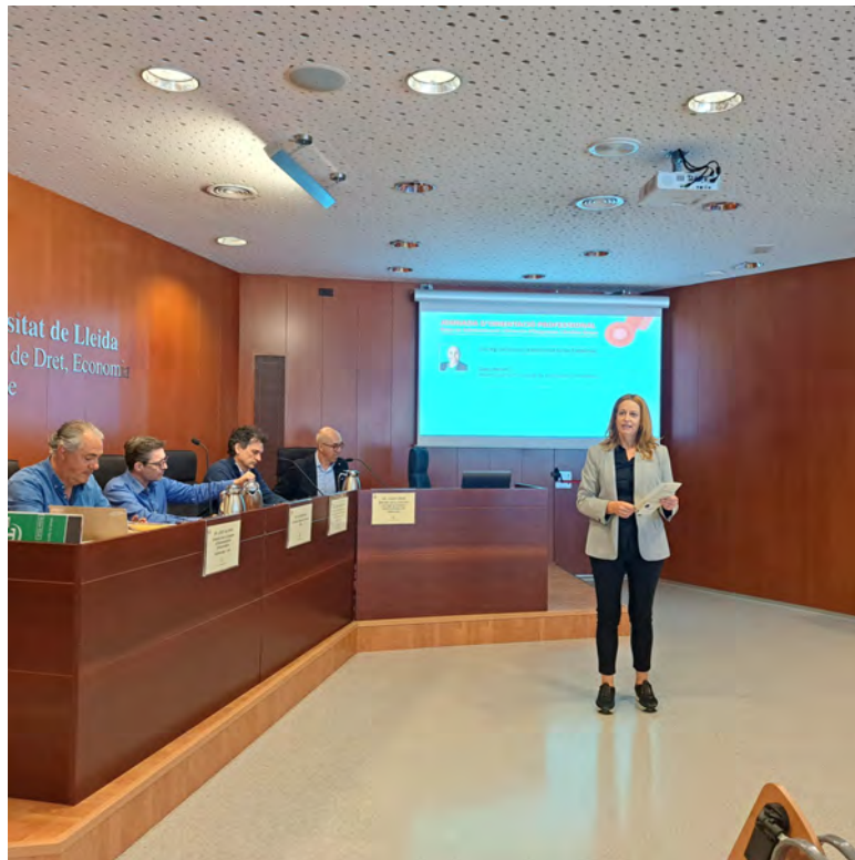
Imatge de la Jornada on va participar el director de la Càtedra