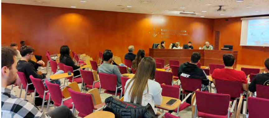
Imatges dels ponents amb el director de la Càtedra, i dels assistents