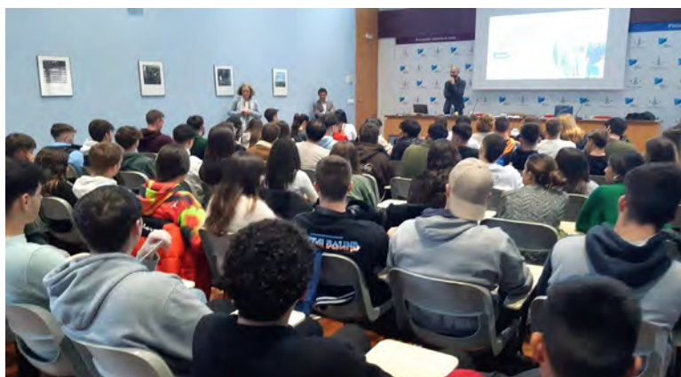
Imatges dels ponents amb el director de la Càtedra, i dels assistents