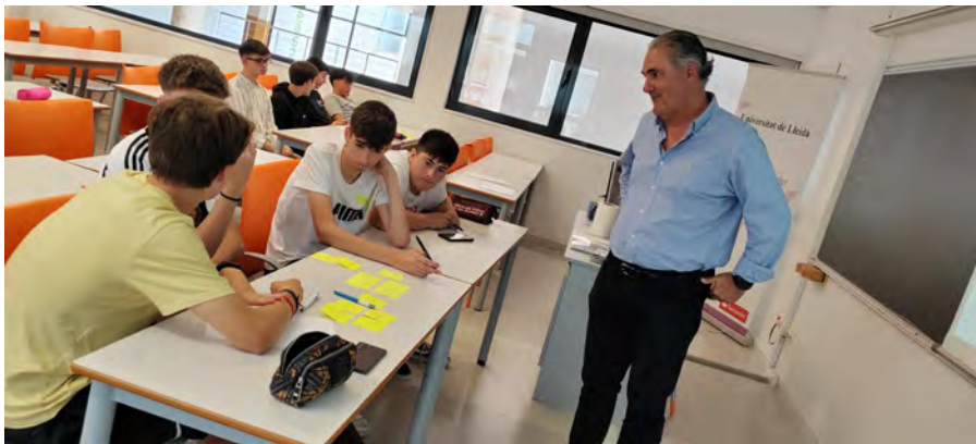
Imatges del taller, amb els alumnes fent una activitat grupal