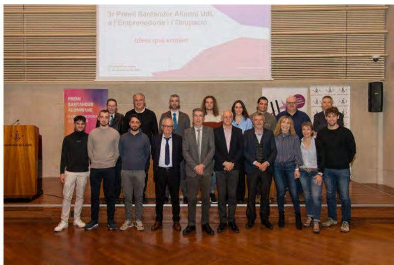
Foto de grup