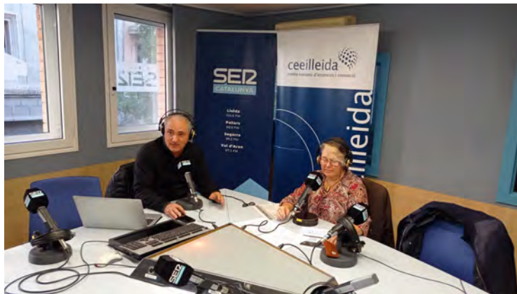
El director de la Càtedra en un moment de l'entrevista