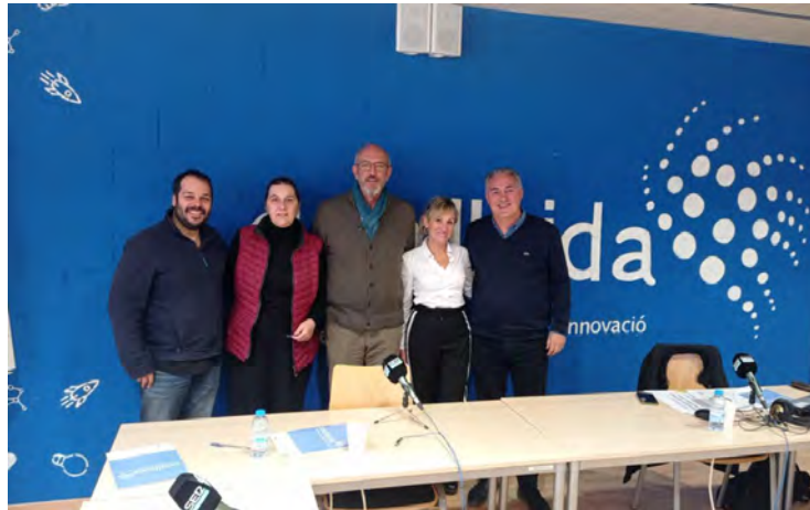
Foto dels participants al debat