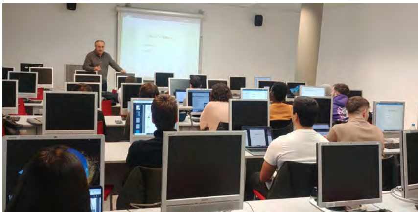
Imatge d'una de les sessions amb el director de la Càtedra

Les sessions es distribueixen entre el 1r i 2n semestre de cada curs acadèmic, i es fan a la Facultat de Dret, Economia i Turisme, campus de Cappont.